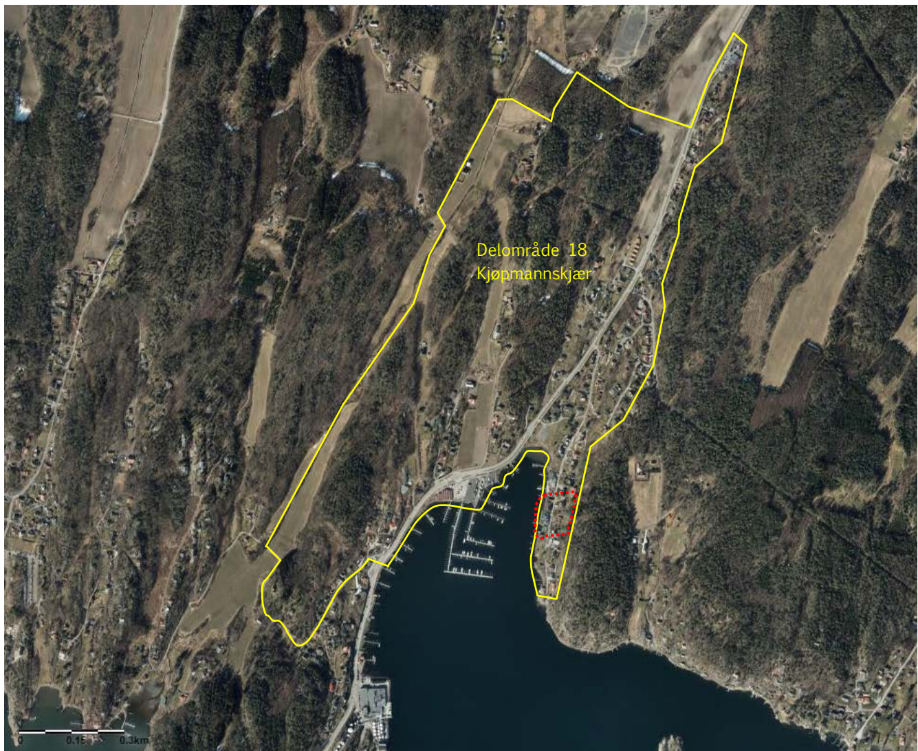
Figur 2. Flyfoto fra www.norgebilder.no tatt 01.04.2019 med delområde 18 skissemessig markert med gult og potensiell faresone med stiplet rødt.