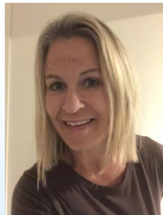
Eirin Neslow Tjeneste for psykisk helse og rus