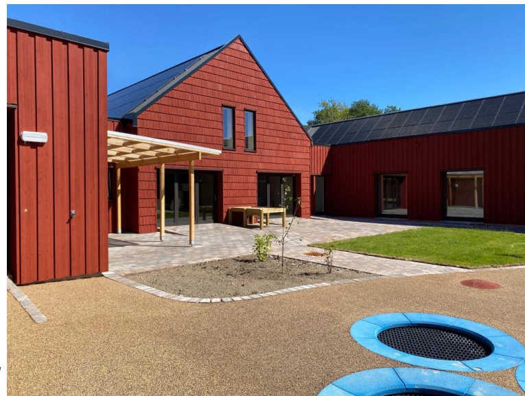
Bildet viser Rødstunet i Arendal