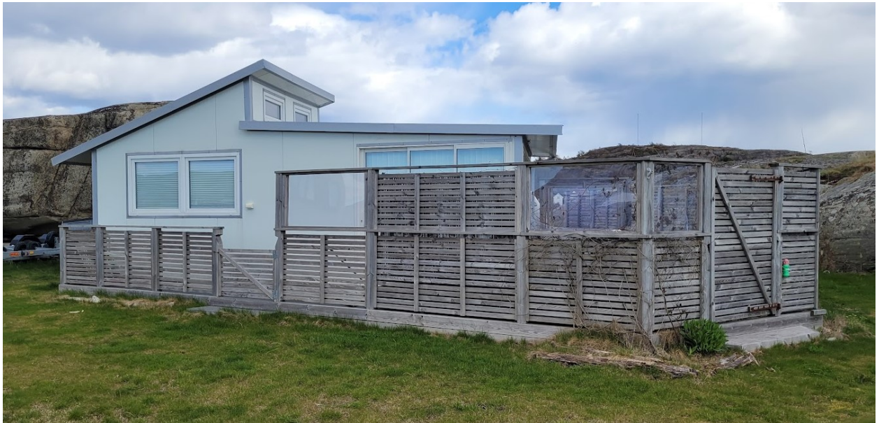
Den største og mest omfattende campingenheten

De isolerte forteltene/spikerteltene er i all hovedsak levert av to produsenter, Mestercamp og Villacamp. Spikerteltene er fast montert til terrassene de er plassert på , og det er ingenting som tyder på at de blir demontert utenfor sesong.