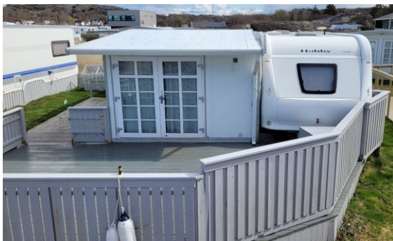
Tilfeldig utvalgt campingenhets som illustrasjon