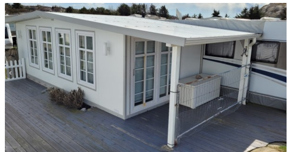
Tilfeldig utvalgt campingenhets som illustrasjon

Det har altså i perioden 2007 – 2019 blitt oppført 46 isolerte fortelt/spikertelt, og et stort antall terrasser, gjerder og leegger som må anses som faste installasjoner.