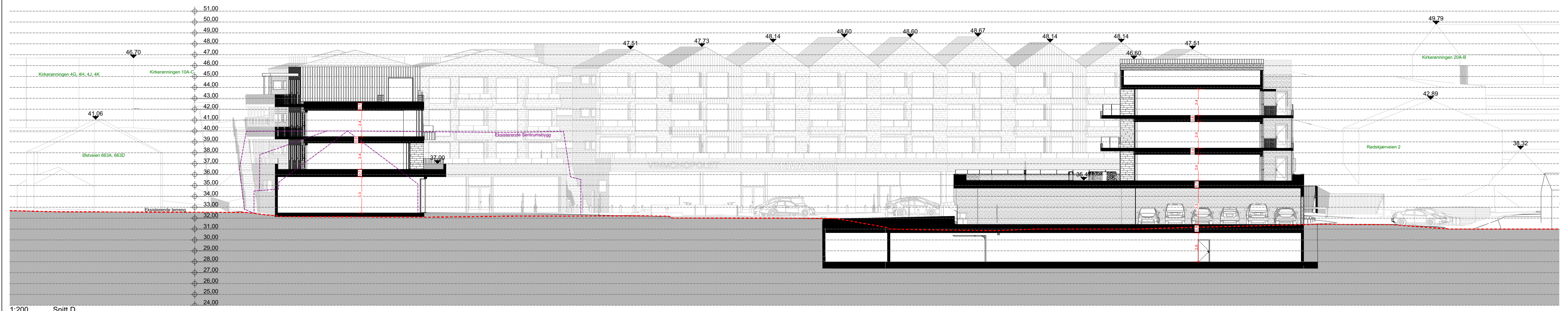
1:200 Snitt D Fra vest - mot øst.

FORELØPIG UTKAST 15.09.23 FORELØPIG UTKAST justert 26.09.23