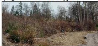
Gjengrodd strand Tørkopp nord.