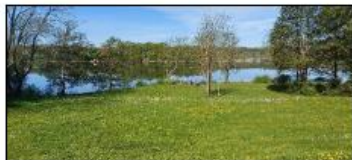
Slette mot badeplass.