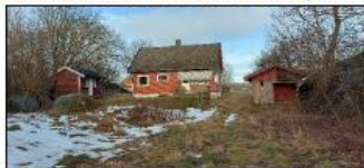
Bebyggelsen mot nord.