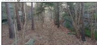
Sti i østre glove.