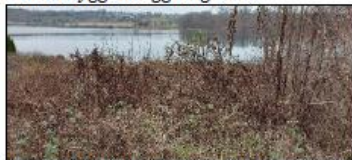
Gjengrodd slette Tørkopp nord.