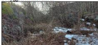
Vestre glove mot sør.