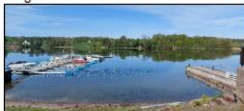
Privat bryggeanlegg lengst sør.