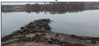
Sted for krabbefiskebrygge.