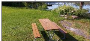
Benk ved badeplass.