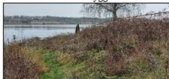
Gjengrodd adkomst Tørkopp nord.