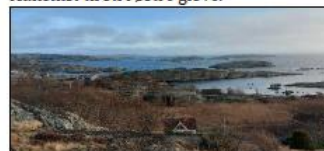
Utsikt fra Grepankolten mot øst.