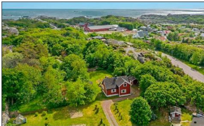
Oversikt over friluftsområdet mot sør.