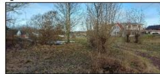
Hagen mot nord.