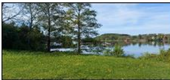
Planlagt grillplass i kanten av sletta.