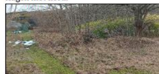
Adkomst til sti i østre glove.