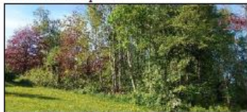
Skogholt nord for hovedslette.