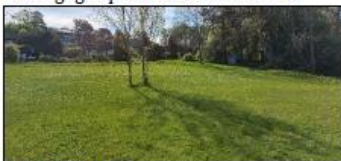
Slette med blomstereng øverst.