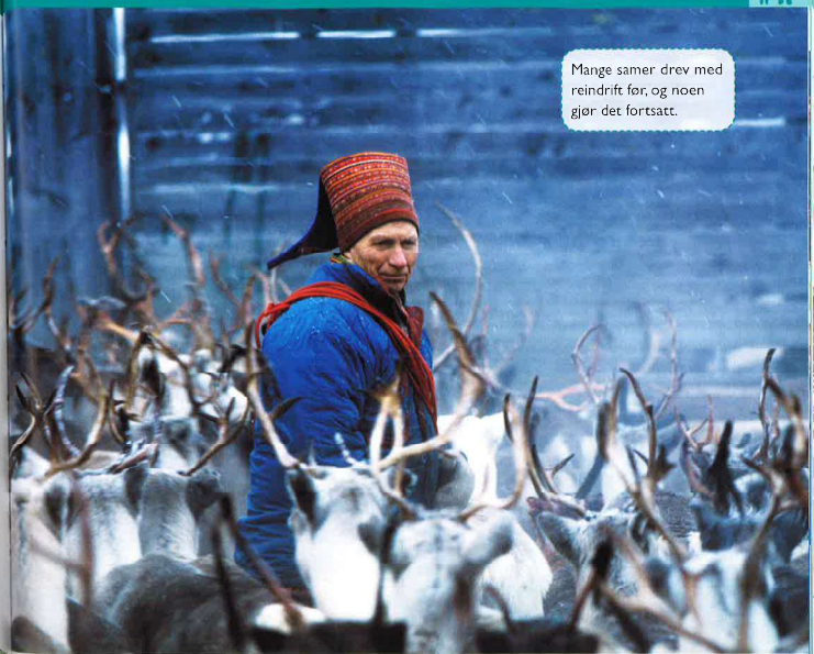
Mange samer drev med reindrift før, og noen gjør det fortsatt.