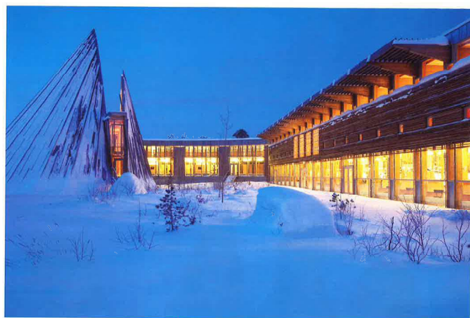
Sametingsbygningen i Karasjok.

Sametinget skal jobbe med saker som er viktige for samene. Til nå har det blant annet jobbet med saker som handler om reindrift, samisk språk, samisk kirkeliv og samisk helsetjeneste. Sametinget skal uttale seg og gi råd til Stortinget i saker som er viktige for samene. Sametinget skal også fordele penger fra staten til ulike samiske organisasjoner.