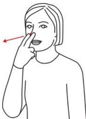
hensyn (ta hensyn til)