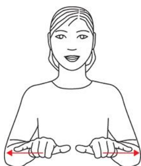
is (på bakken)